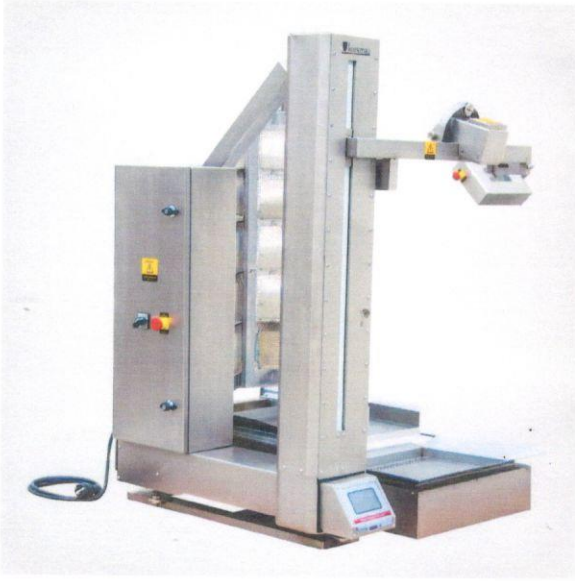
1.3 Döner Pişirme Robotu