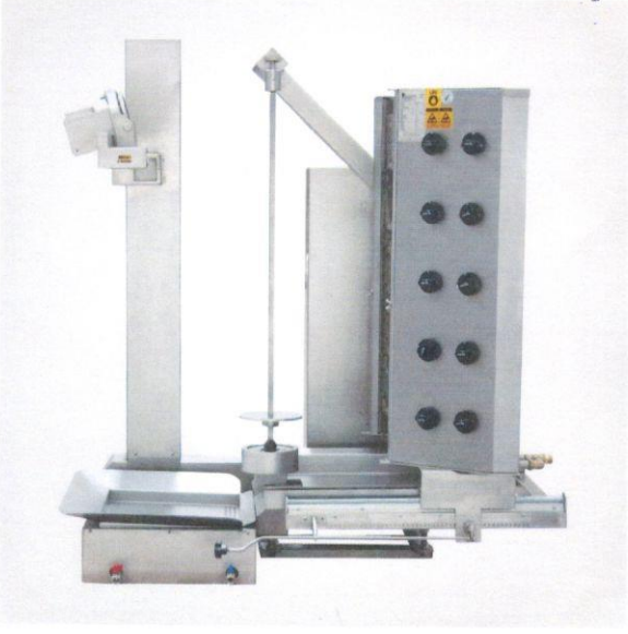
1.5 Döner Pişirme Robotu