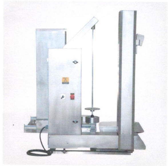
1.4 Döner Pişirme Robotu