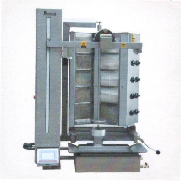
1.1 Döner Pişirme Robotu